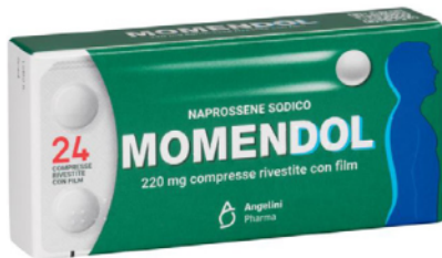
MOMENDOL 220 mg 24 compresse rivestite