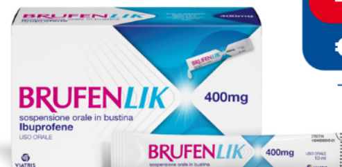
BRUFENLIK 400 mg 20 bustine da 10 ml