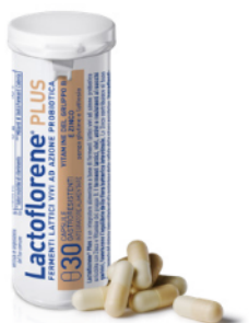
LACTOFLORENE PLUS 30 capsule

IL TUO FARMACISTA AL TUO FIANCO, PER ASCOLTARTI SEMPRE.