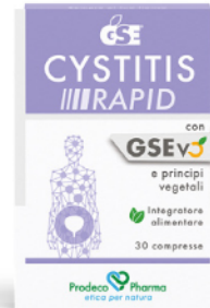
GSE CYSTITIS RAPID 30 compresse