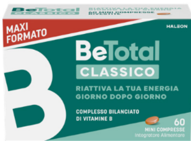
BETOTAL CLASSICO 60 mini compresse