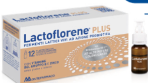
LACTOFLORENE PLUS 12 flaconcini

È un medicinale senza obbligo di prescrizione (SOP) che può essere consegnato solo dal farmacista. Ascolta il tuo Farmacista.