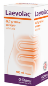
LAEVLAC 66,7 g/100 ml SCIROPPO Flacone 180 ml