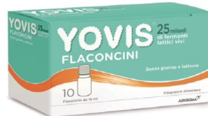
YOVIS FLACONCINI 10 flaconcini da 10 ml