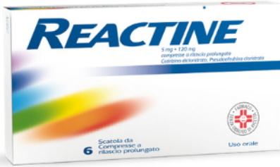
REACTINE 5 mg + 120 mg 6 compresse a rilascio prolungato