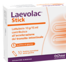
LAEVLAC STICK 10 bustine monodose